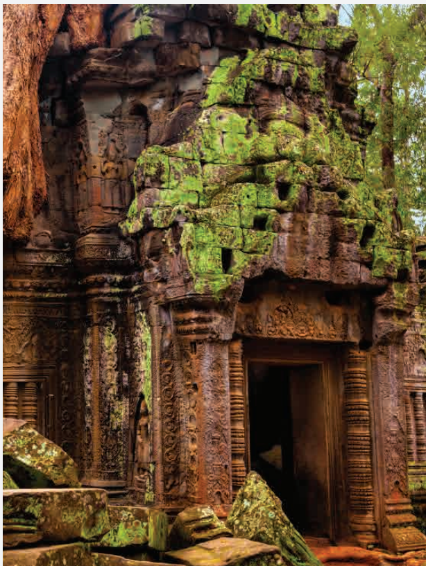
Angkor Wat / Angkor - Kambodscha Erbaut ca. 1300