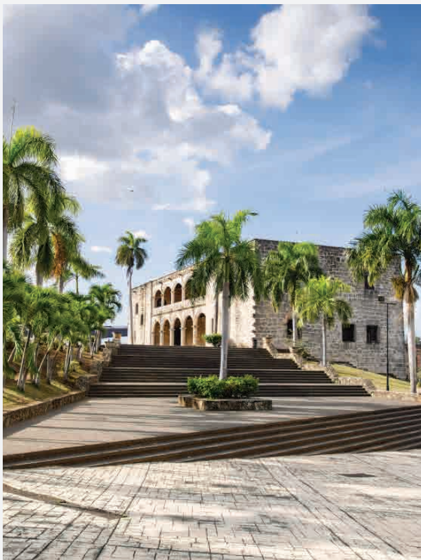
Palast Alcázar de Colón / S.D. - Dominikanische Republik Erbaut 1514