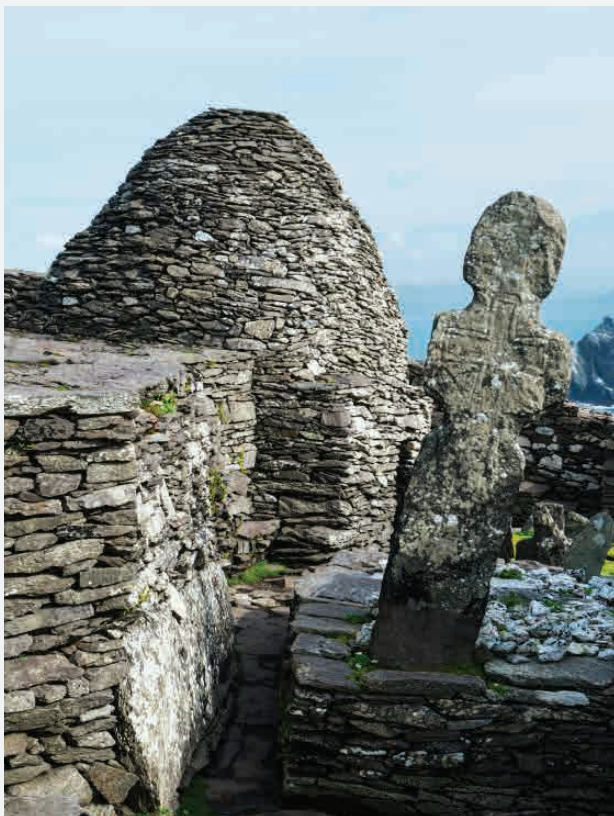
Skellig Michael / Küste Kerrys - Irland Erbaut ca. 590 n. Chr.