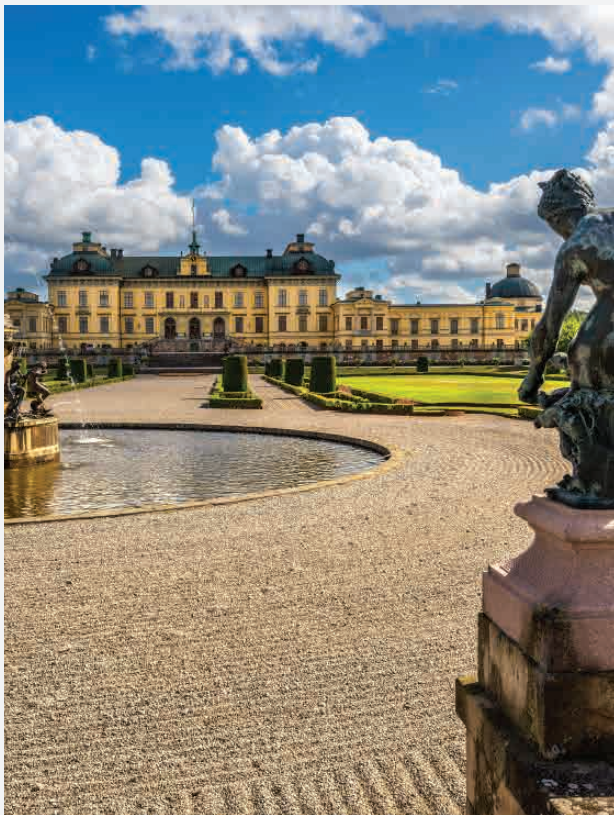
Schloss Drottningholm / Lovön - Schweden Erbaut ca. 1681