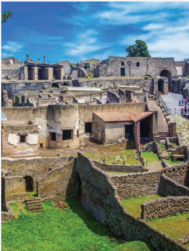
Pompeji / Neapel - Italien Erbaut ca. 700 v. Chr.