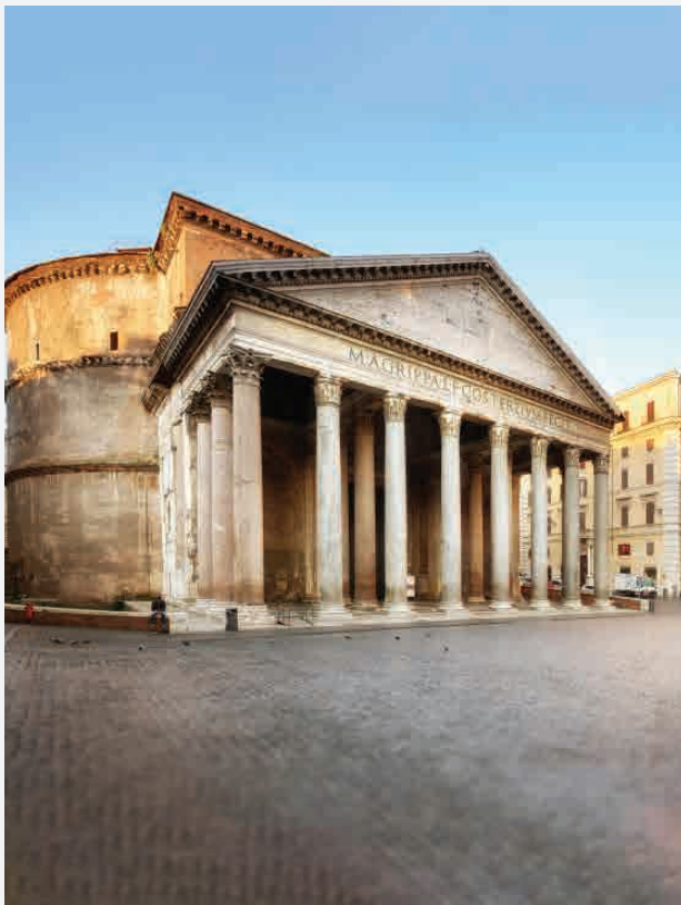
Pantheon / Rom - Italien Erbaut ca. 125 n. Chr.