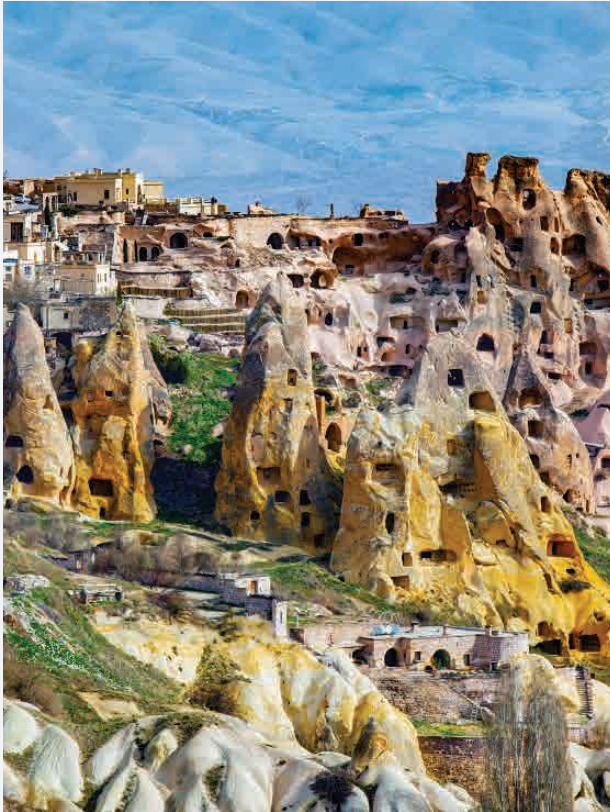
Höhlen von Kappadokien / Göreme - Türkei Erbaut ca. 2200 bis 800 v. Chr.