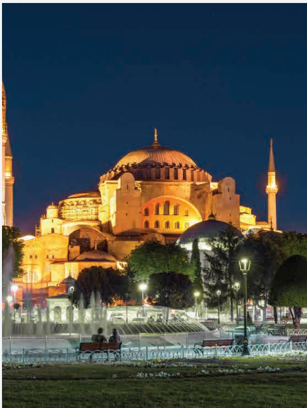
Hagia Sophia / Istanbul - Türkei Erbaut ca. 537 n. Chr.