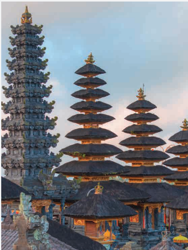
Pura Besakih Tempel / Indonesien - Bali Erbaut ca. 800 n. Chr.