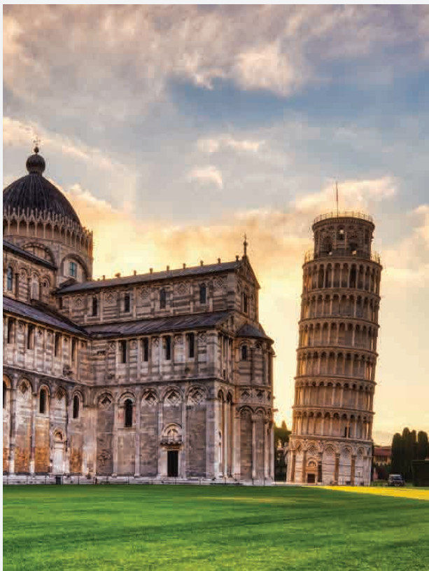
Schiefer Turm von Pisa / Pisa - Italien Erbaut 1185 - 1372