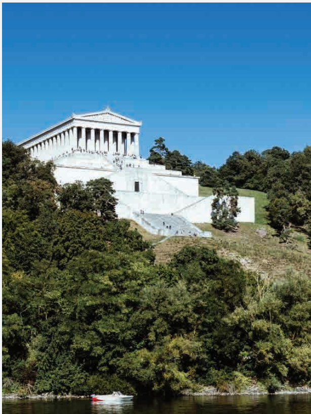
Walhalla / Regensburg - Deutschland Erbaut 1842