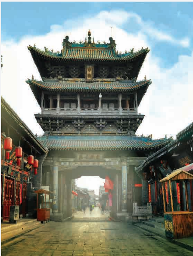
Glockenturm / Pingyao - China Erbaut ca. 1370