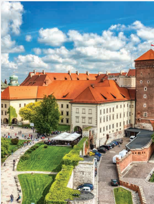
Burganlage Wawel / Krakau - Polen Erbaut ca. 1040 - 1795