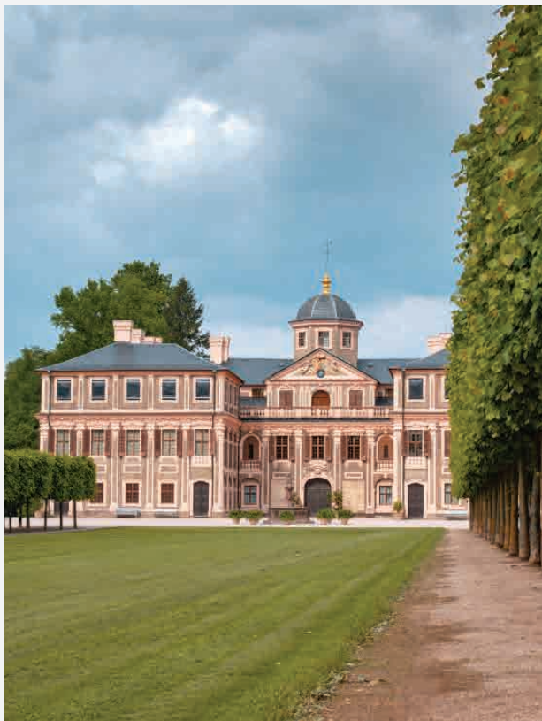
Schloss Favorite / Rastatt - Deutschland Erbaut 1710 bis 1730