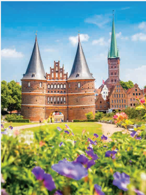
Holstentor / Lübeck - Deutschland Erbaut ca. 1478