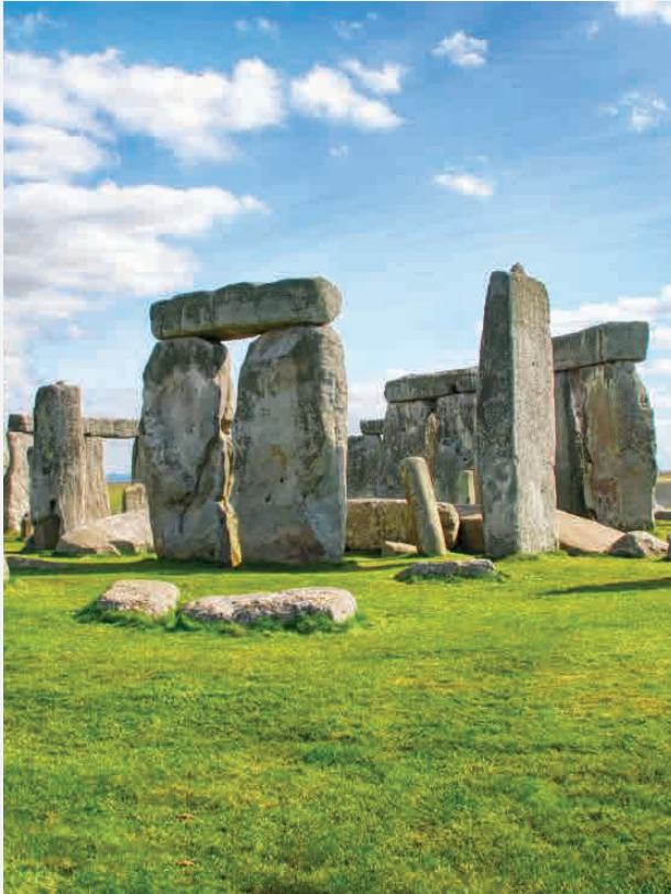
Stonehenge / England Erbaut ca. 2100 v. Chr.