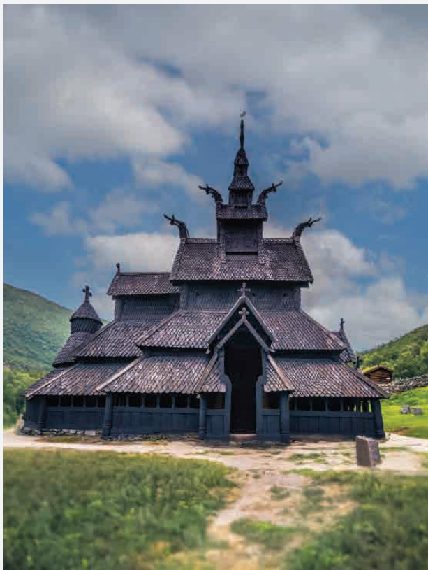
Stabkirche Borgund / Laerdal - Norwegen Erbaut ca. 1300