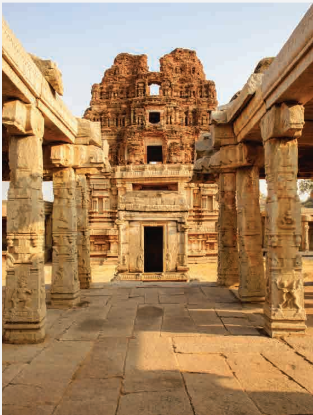
Hampi / Indien Erbaut ca. 1400