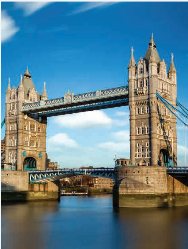
Tower Bridge / London - England Erbaut 1886 - 1894