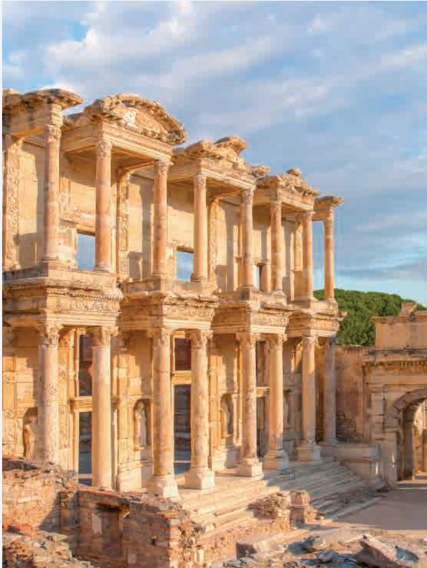
Celsus-Bibliothek / Türkei - Ephesos Erbaut ca. 120 n. Chr.