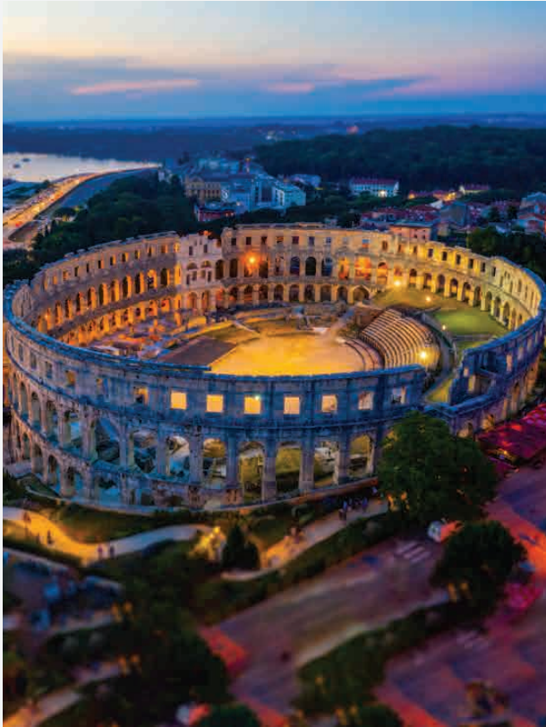
Amphitheater Pula / Pula - Kroatien Erbaut ca. 80 n. Chr.