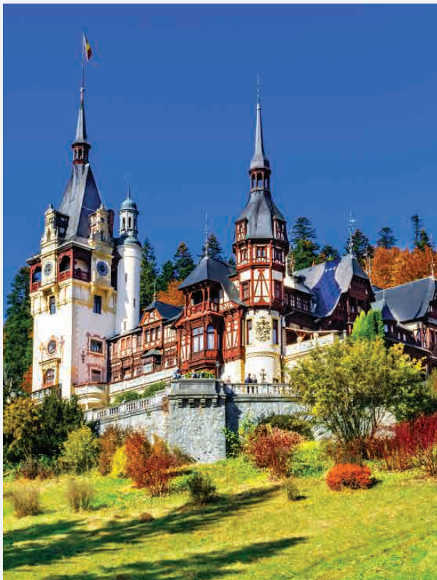
Schloss Peleş / Sinaia - Rumänien Erbaut 1883