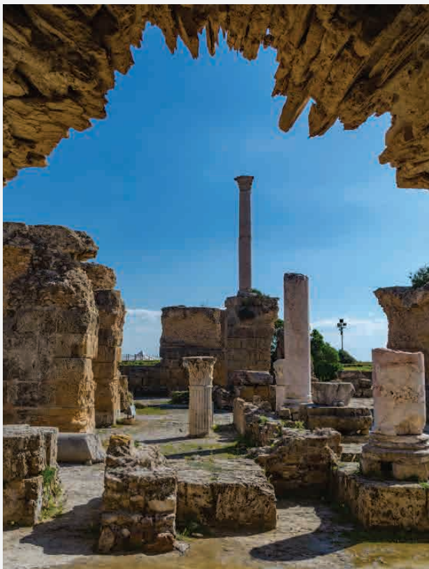
Antoninus-Pius-Thermen / Karthago - Tunesien Erbaut ca. 162 - 146 n. Chr.