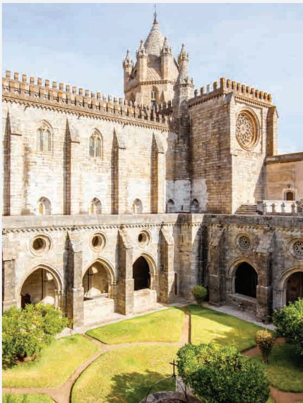
Kathedrale von Évora / Évora - Portugal Erbaut ca. 1200