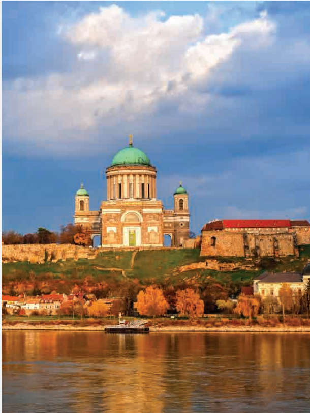
St. Adalbert-Kathedrale / Esztergom - Ungarn Erbaut 1856