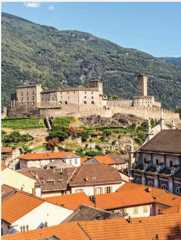
Castelgrande / Bellinzona - Schweiz Erbaut ca. 1250