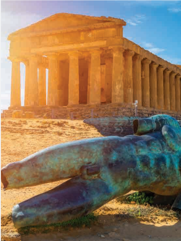
Concordia Tempel (Agrigent) / Sizilien - Italien Erbaut ca. 440 - 430 v. Chr.