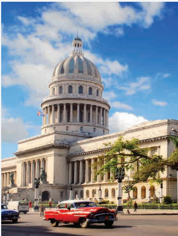
El Capitolio / Havanna - Cuba Erbaut 1929