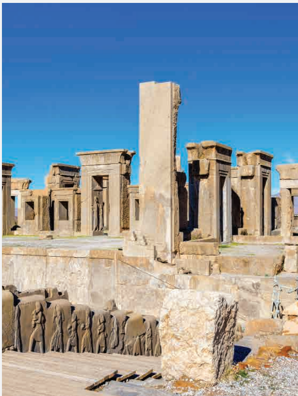
Palast des Darius in Persepolis / Susa - Iran Erbaut ca. 600 v. Chr.