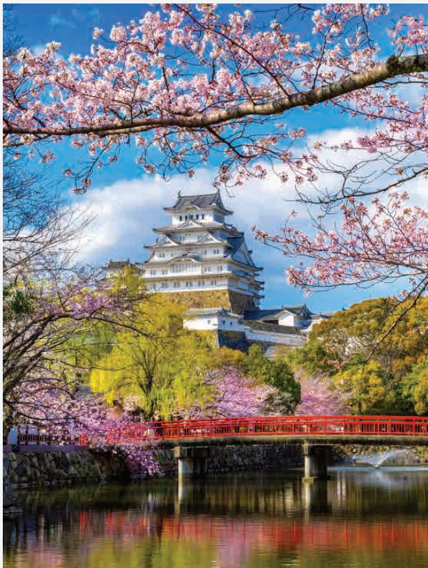
Burg Himeji / Präfektur Hyōgo - Japan Erbaut ca. 1346