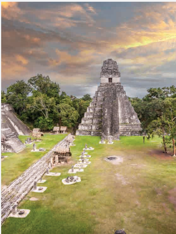
Maya Tempel / Copan - Honduras Erbaut ca. 250 - 900 n. Chr.