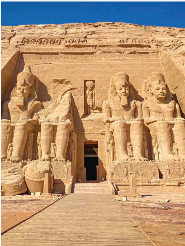
Tempel Ramses II / Abu Simbel - Ägypten Erbaut ca. 1250 v. Chr.