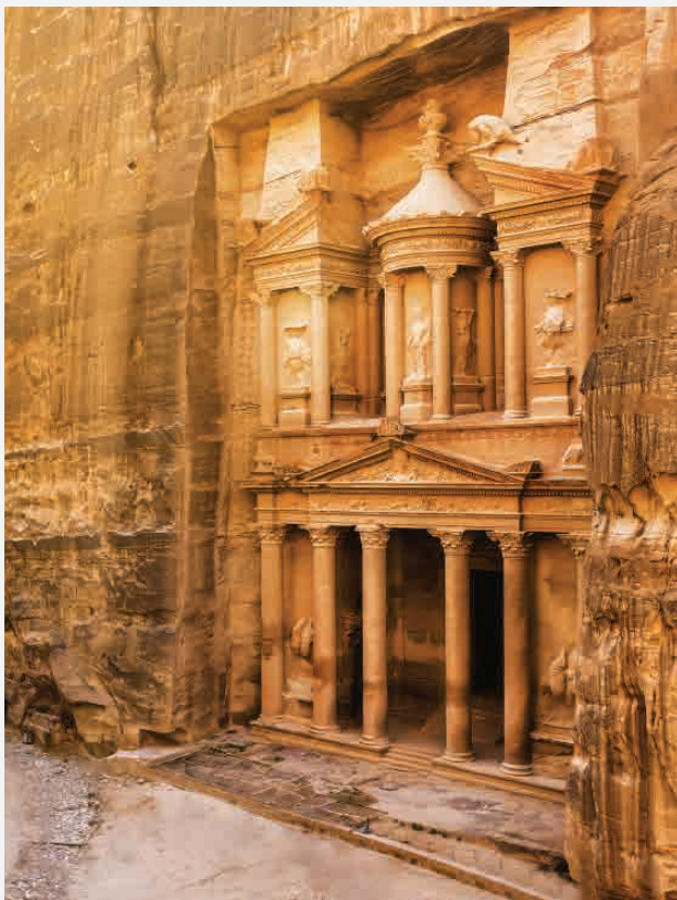
Petra / Jordanien Erbaut ca. 30 n. Chr.