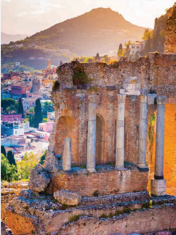
Theater Taormina / Sizilien - Italien Erbaut ca. 300 v. Chr.