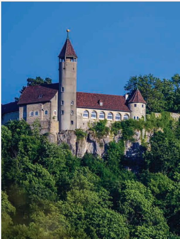
Burg Teck / Kirchheim - Deutschland Erbaut ca. 1100