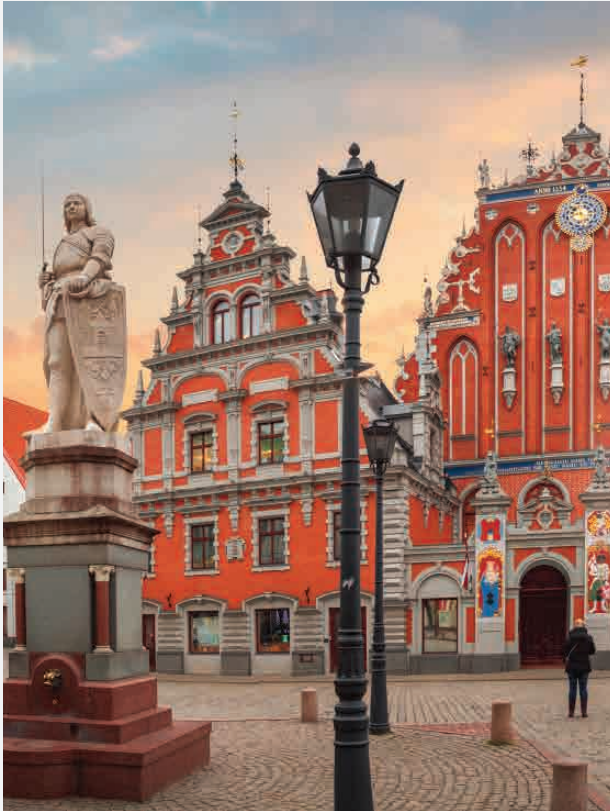
Rigaer Rat / Riga - Lettland Erbaut ca. 1225