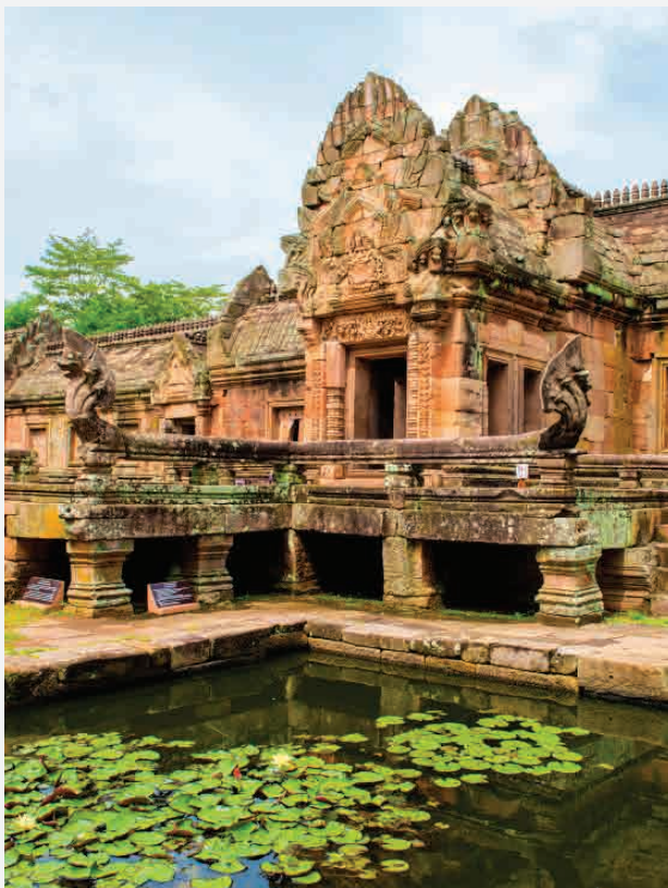
Phanom Rung / Berg Krailasa - Thailand Erbaut ca. 1200