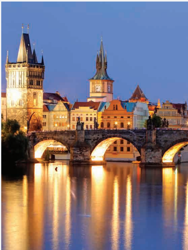
Karlsbrücke / Prag - Tschechien Erbaut ca. 1400