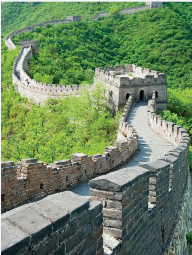
Die Chinesische Mauer / Huairou - China Erbaut ca. 220 v. Chr.