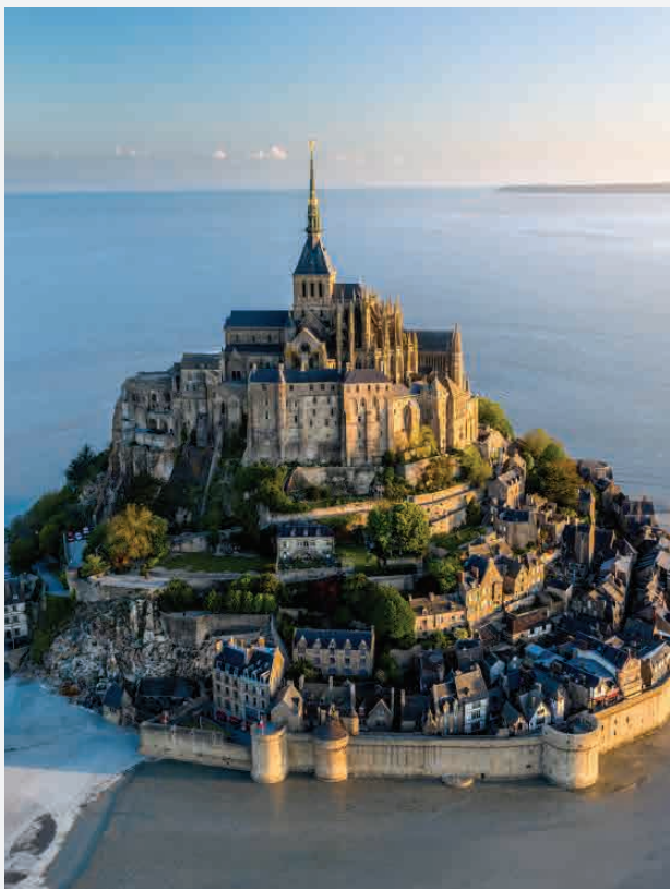
Mont-Saint-Michel / Normandie - Frankreich Erbaut ca. 1020