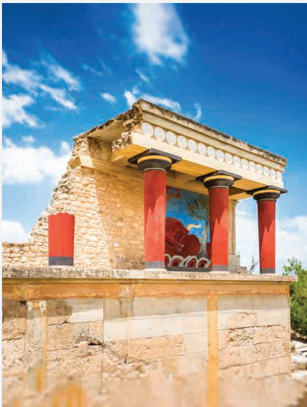
Palast von Knossos / Kreta - Griechenland Erbaut ca. 1750 v. Chr.