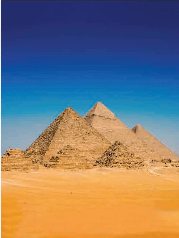
Pyramiden von Gizeh / Gizeh - Ägypten Erbaut ca. 2500 v. Chr.