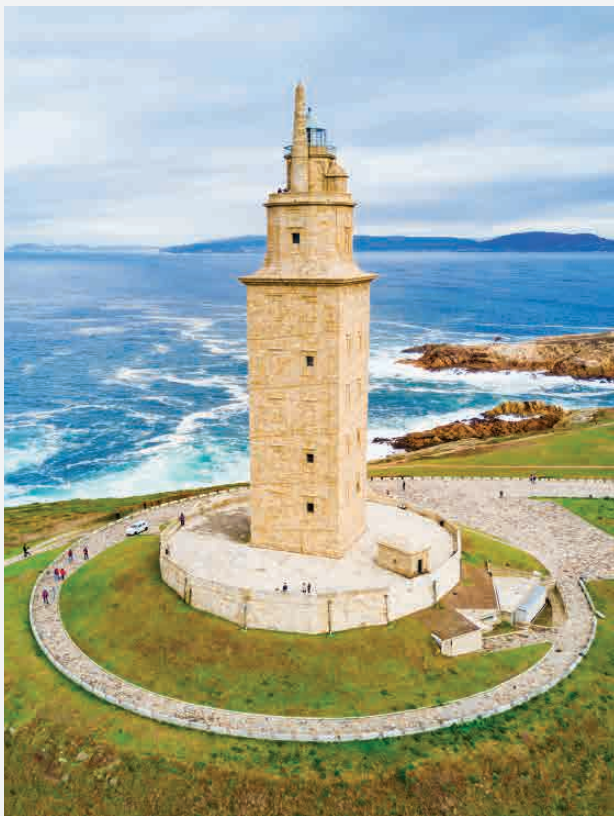
Herkulesturm / A Coruña - Spanien Erbaut ca. 200 n. Chr.