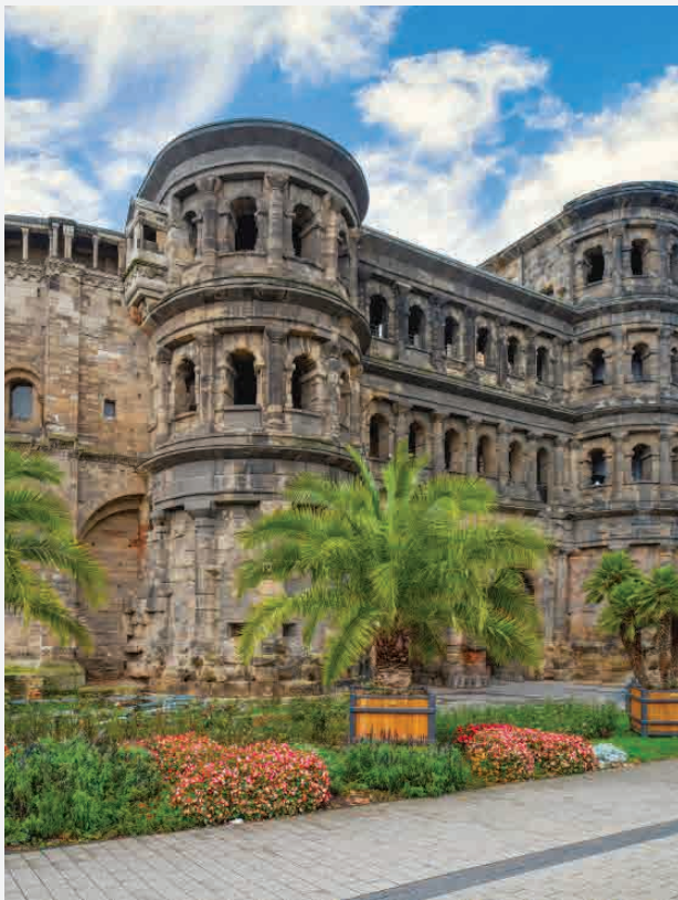
Porta Nigra / Trier - Deutschland Erbaut ca. 170 n. Chr.