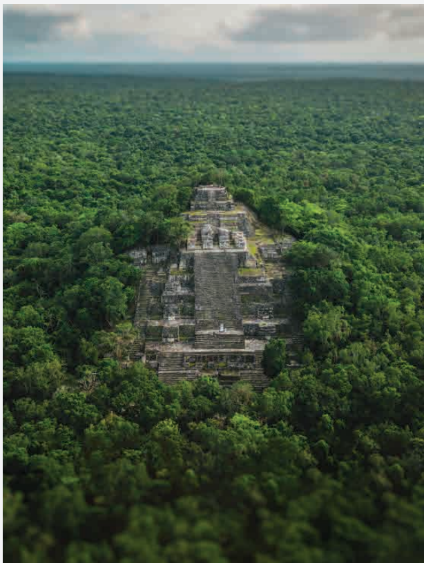
Calakmul (Hauptpyramide) / Campeche - Mexico Erbaut ca. 500 n. Chr.