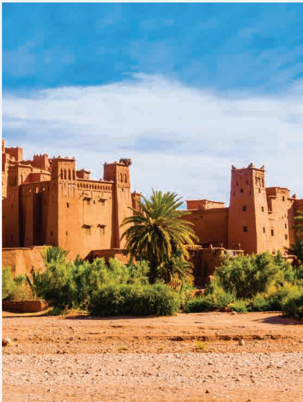
Ait-Ben-Haddou / Ouarzazate - Marokko Erbaut ca. 1200