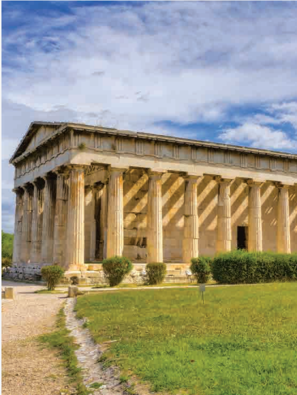
Tempel des Hephaistos / Athen - Griechenland Erbaut ca. 415 v. Chr.