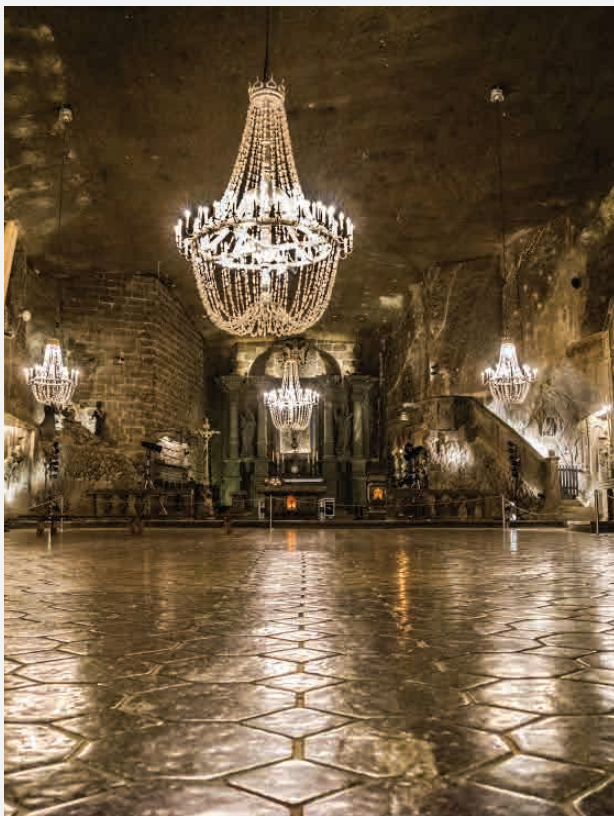
Salzbergwerk Wieliczka / Wieliczka - Polen Erbaut ca. 1280