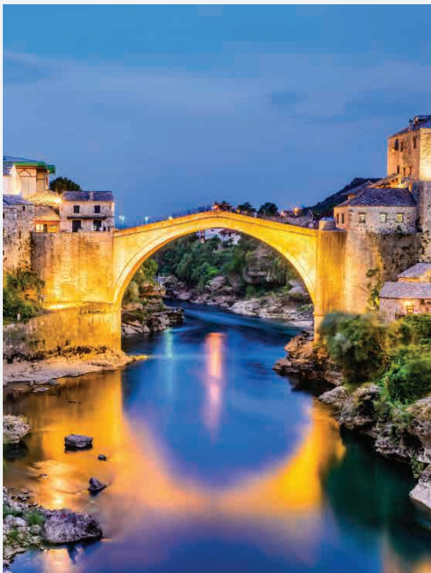
Stari most / Mostar - Bosnien-Herzegowina Erbaut 1566