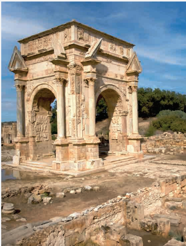
Leptis Magna / al Chum - Libyen Erbaut ca. 800 v. Chr.