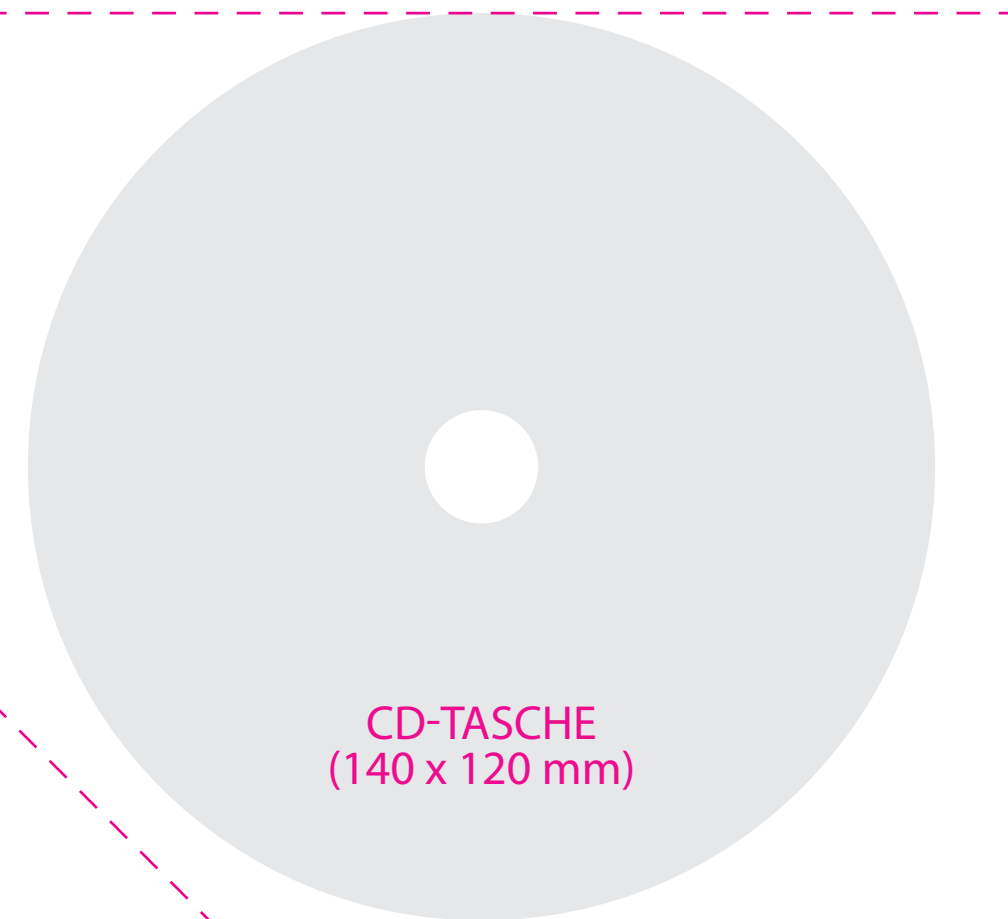
CD-TASCHE (140 x 120 mm)