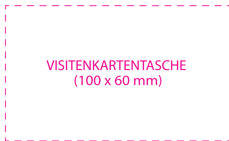
VISITENKARTENTASCHE (100 x 60 mm)