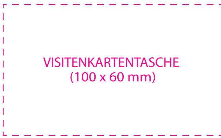
VISITENKARTENTASCHE (100 x 60 mm)