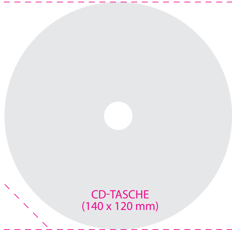
CD-TASCHE (140 x 120 mm)