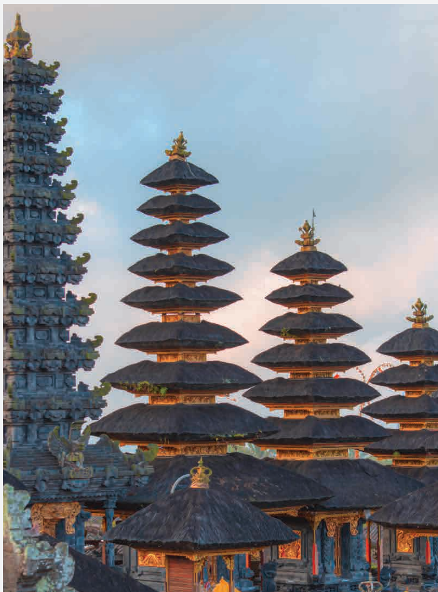
Pura Besakih Tempel / Indonesien - Bali