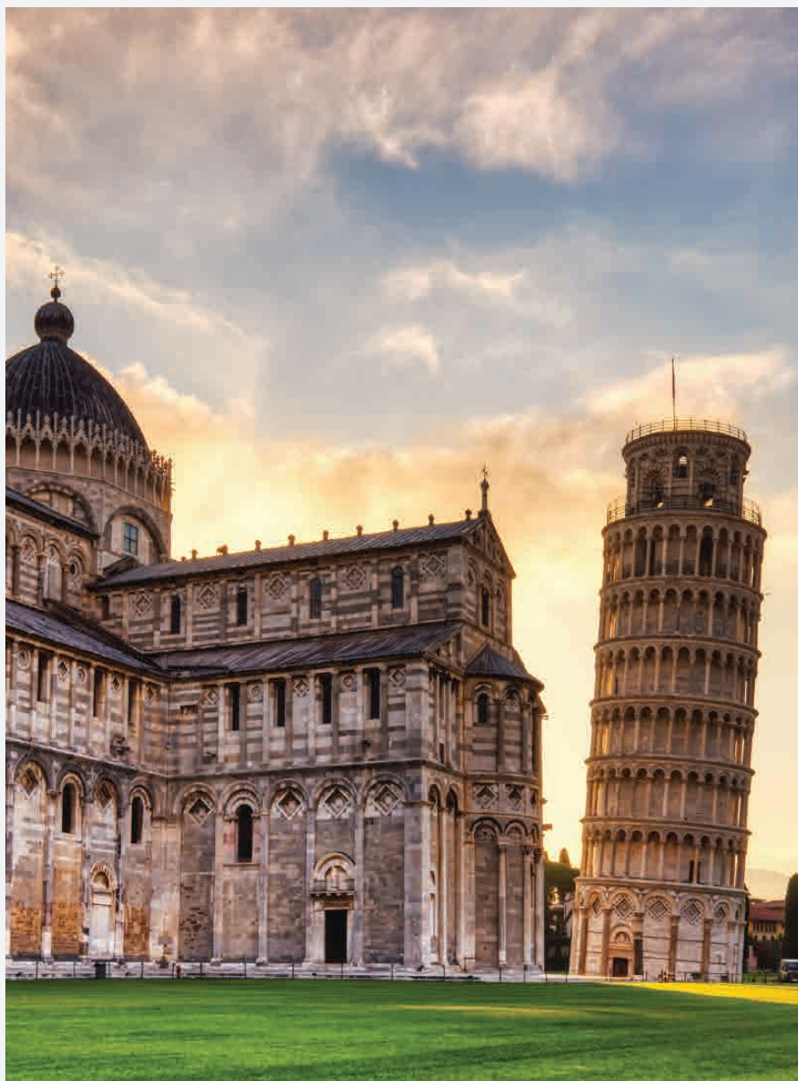
Schiefer Turm von Pisa / Pisa - Italien