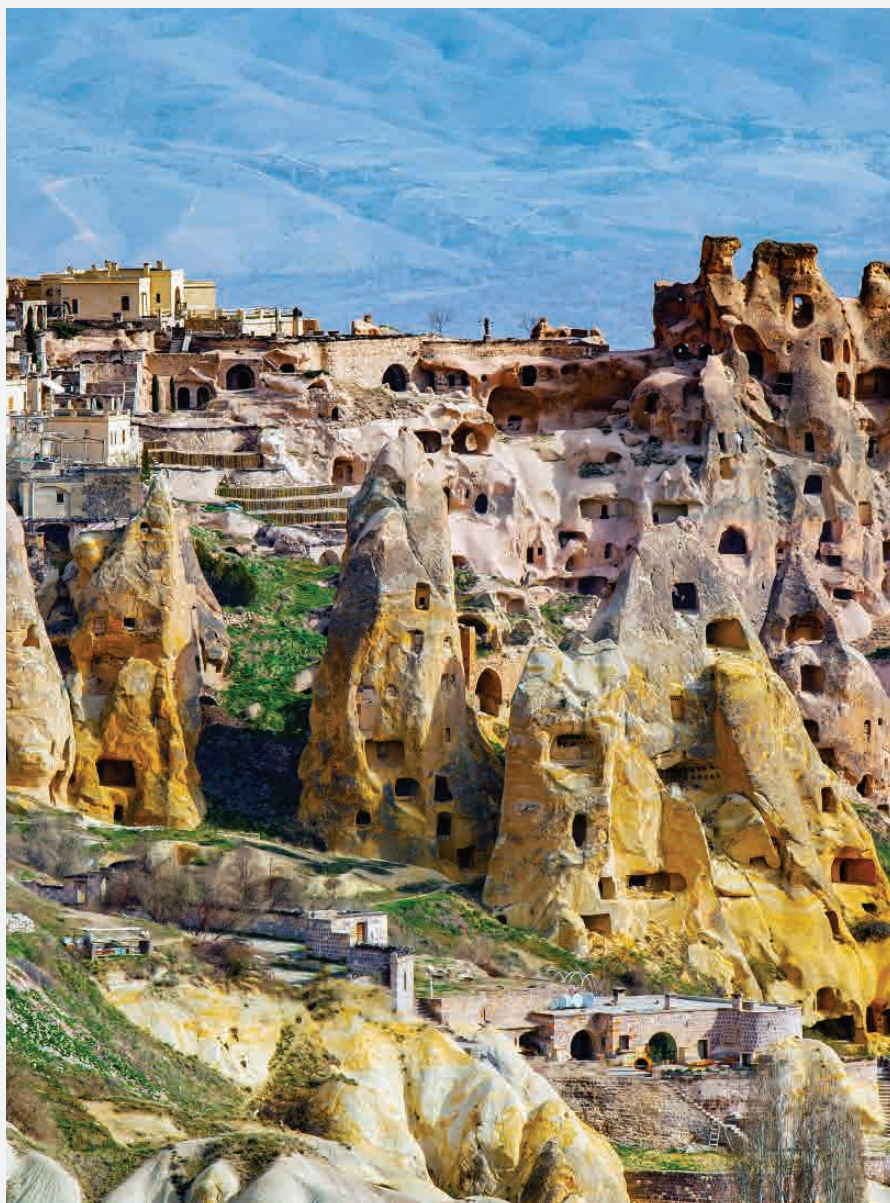
Höhlen von Kappadokien / Göreme - Türkei