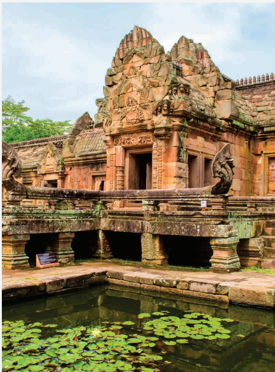
Phanom Rung / Berg Krailasa - Thailand Erbaut ca. 1200