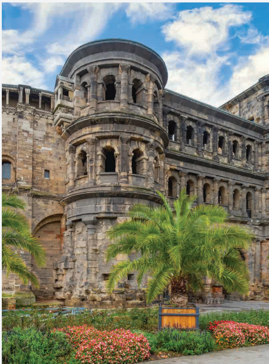
Porta Nigra / Trier - Deutschland