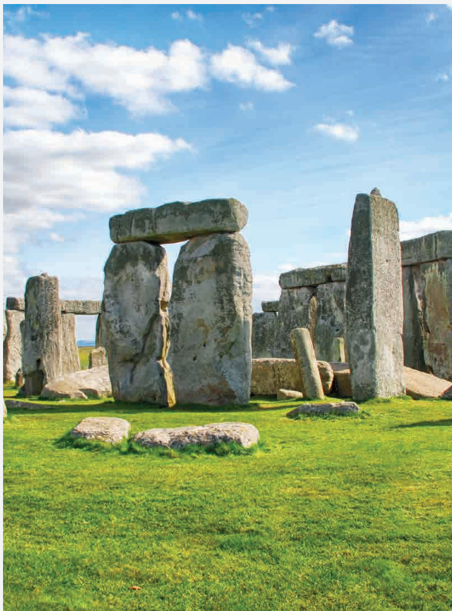
Stonehenge / England Erbaut ca. 2100 v. Chr.