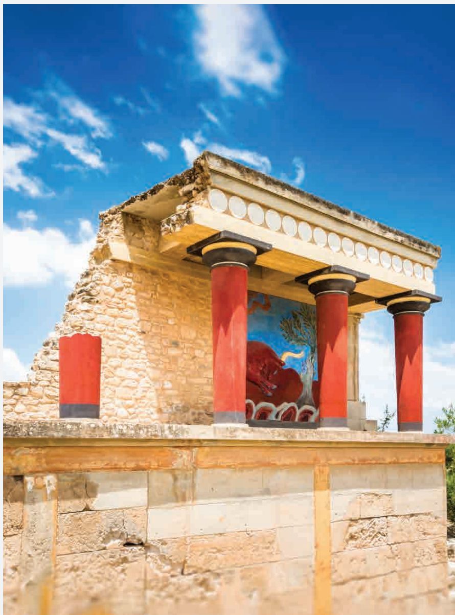
Palast von Knossos / Kreta - Griechenland Erbaut ca. 1750 v. Chr.