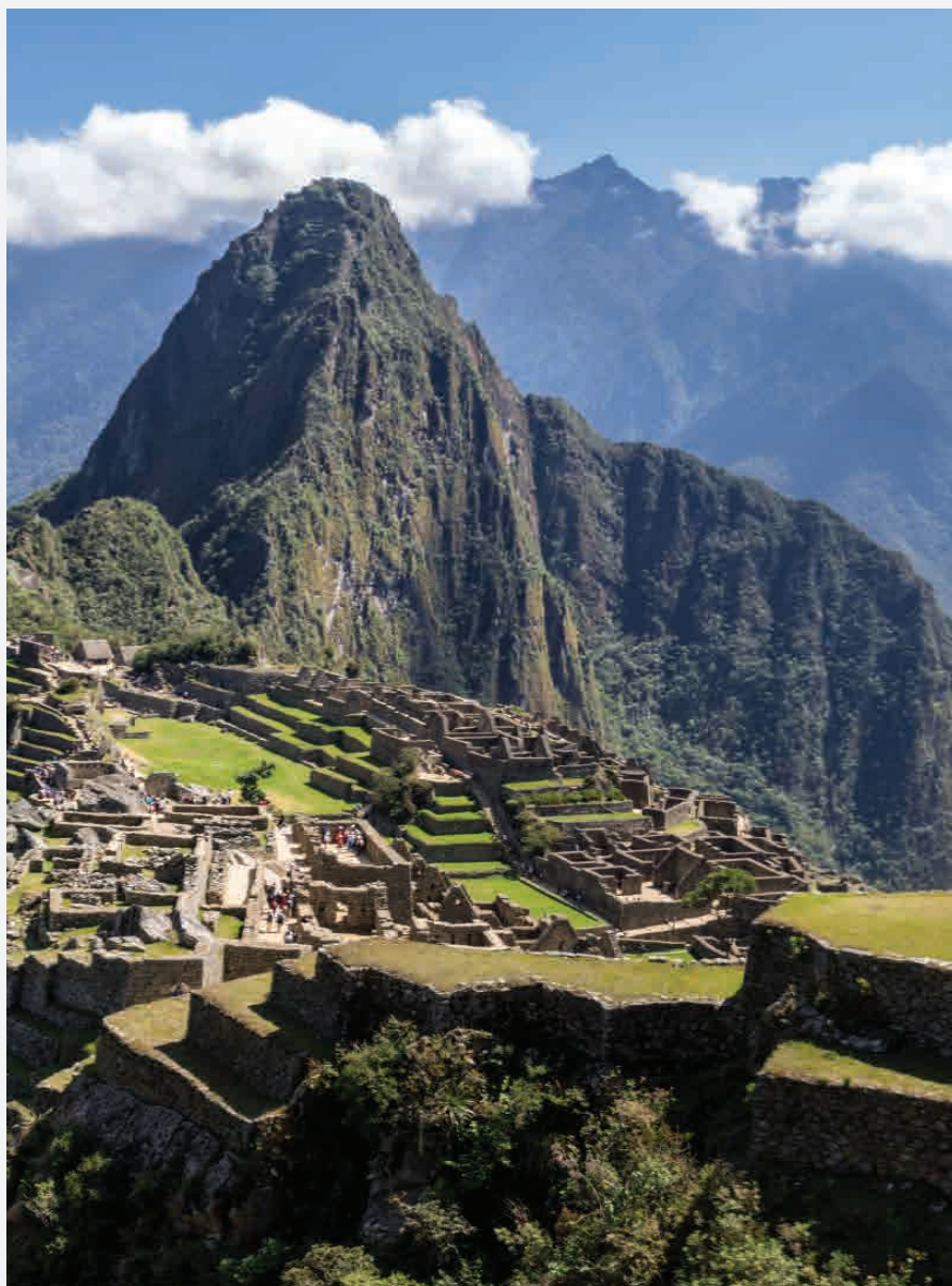
Machu Picchu / Anden - Peru