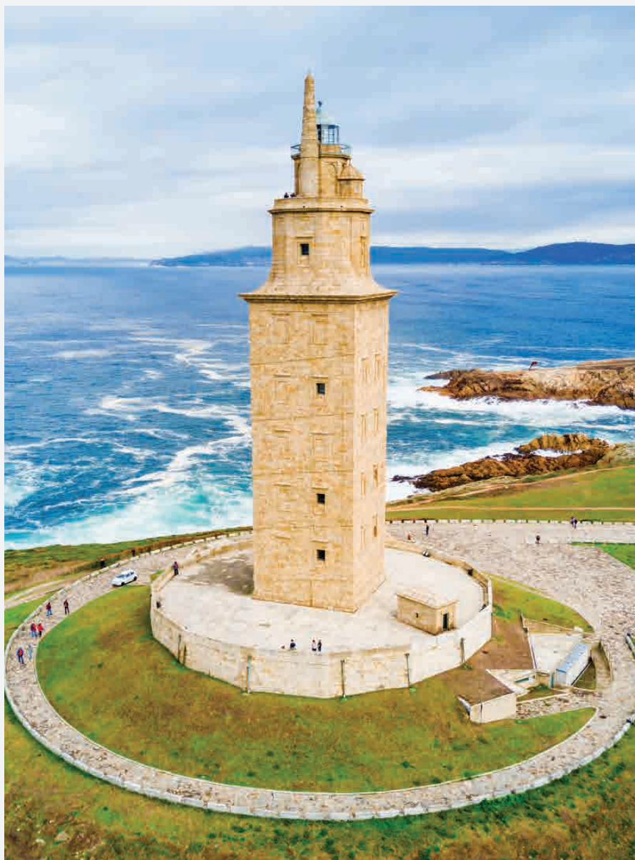
Herkulesturm / A Coruña - Spanien Erbaut ca. 200 n. Chr.