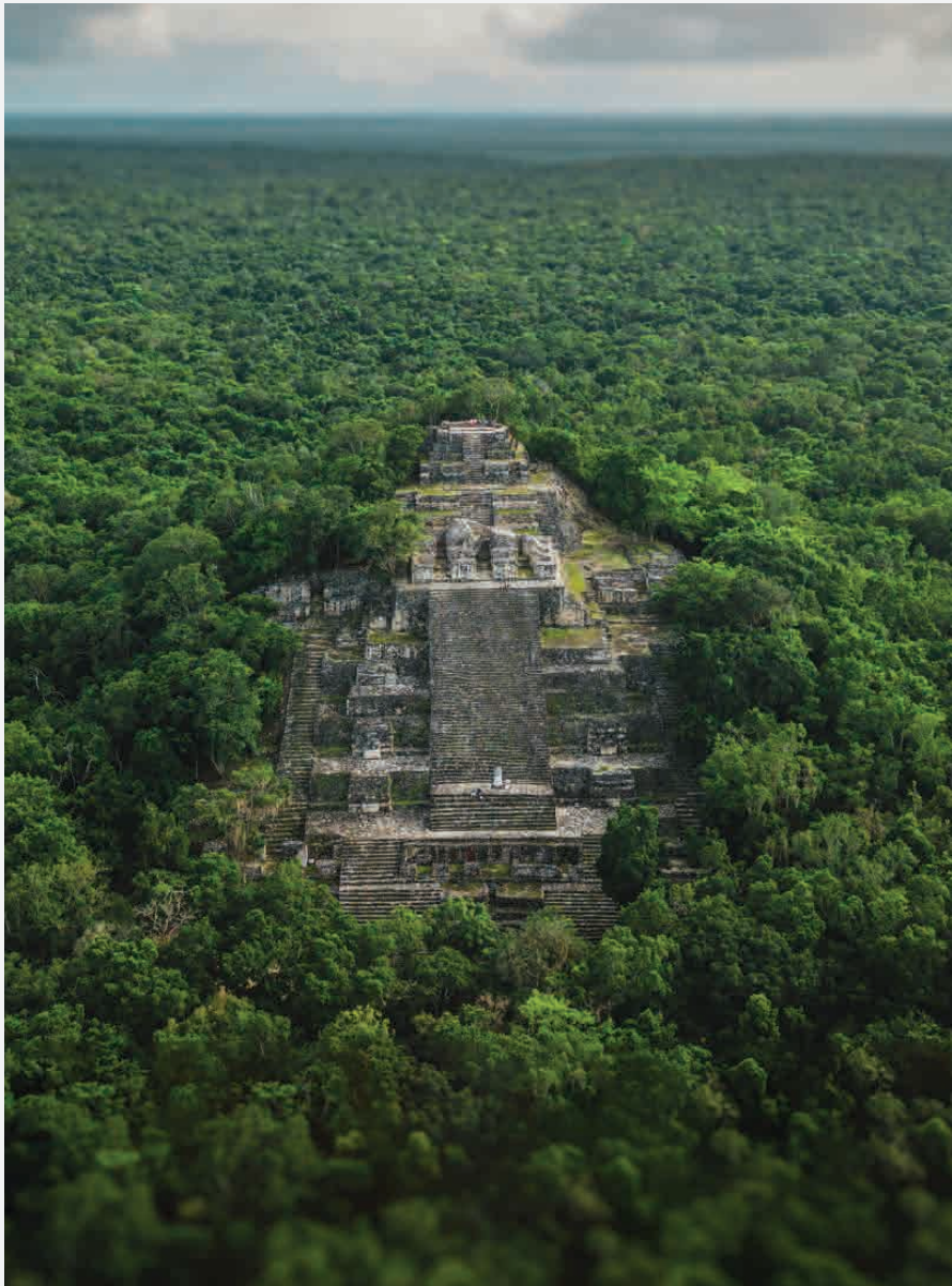
Calakmul (Hauptpyramide) / Campeche - Mexico Erbaut ca. 500 n. Chr.