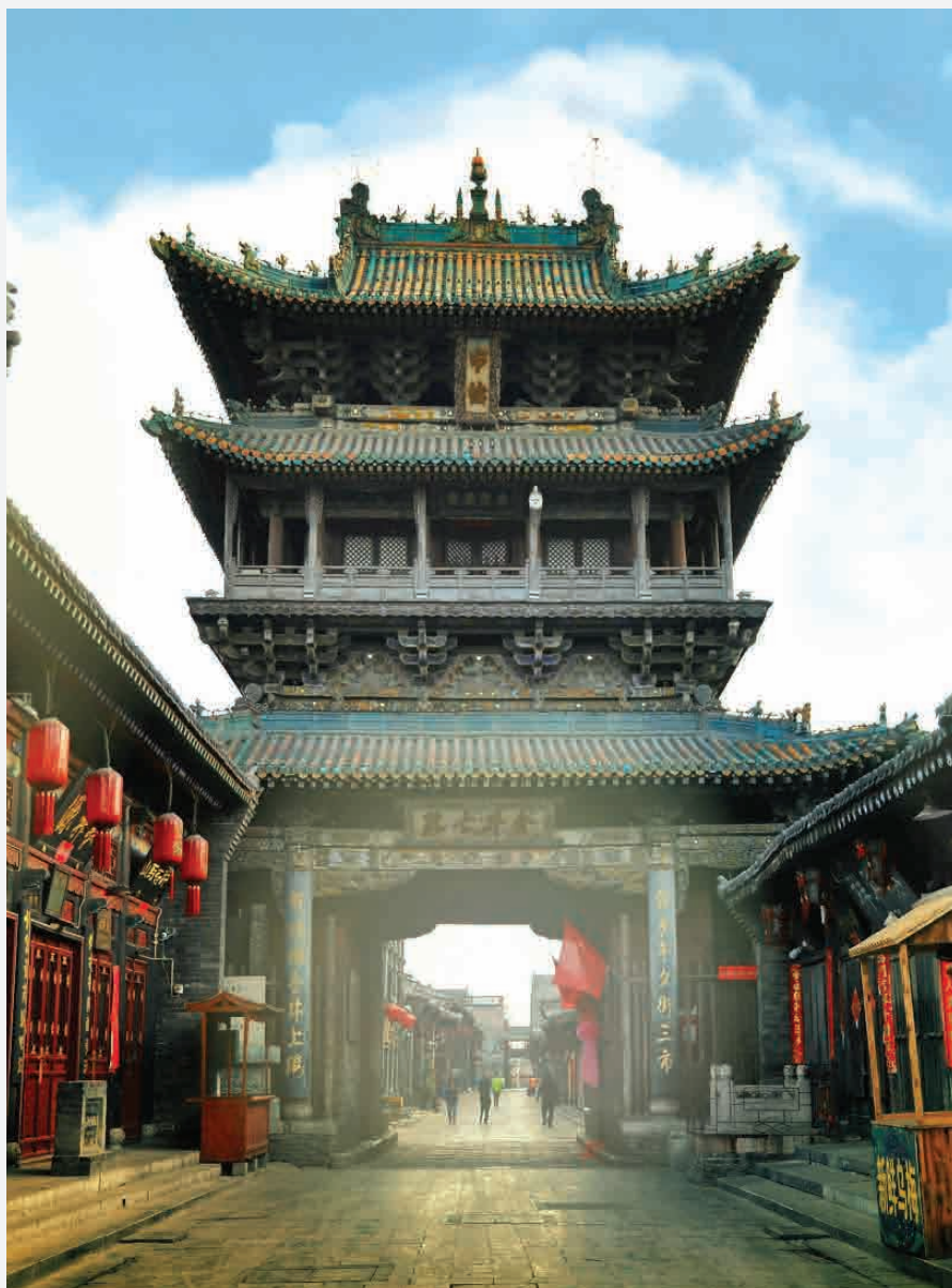
Glockenturm / Pingyao - China