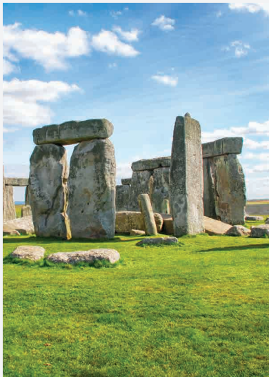
Stonehenge / England Erbaut ca. 2100 v. Chr.