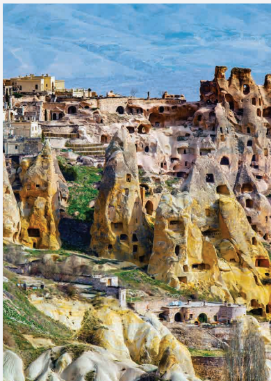
Höhlen von Kappadokien / Göreme - Türkei Erbaut ca. 2200 bis 800 v. Chr.