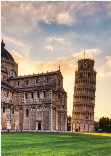
Schiefer Turm von Pisa / Pisa - Italien Erbaut 1185 - 1372