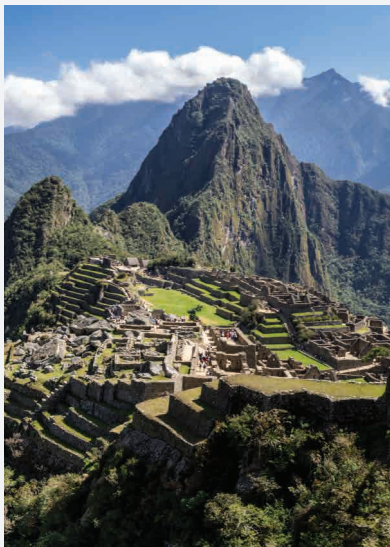
Machu Picchu / Anden - Peru Erbaut ca. 1450