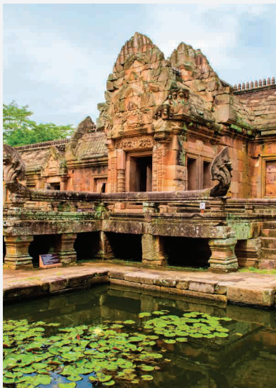
Phanom Rung / Berg Krailasa - Thailand Erbaut ca. 1200