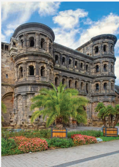
Porta Nigra / Trier - Deutschland Erbaut ca. 170 n. Chr.