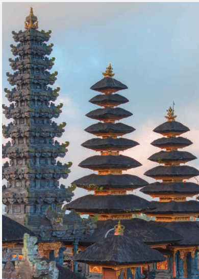
Pura Besakih Tempel / Indonesien - Bali Erbaut ca. 800 n. Chr.