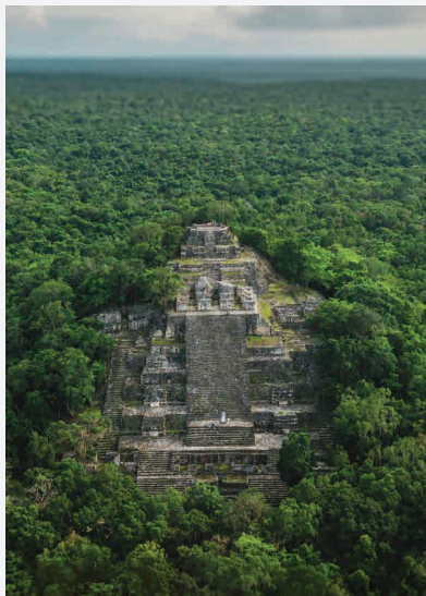
Calakmul (Hauptpyramide) / Campeche - Mexico Erbaut ca. 500 n. Chr.