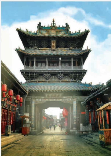
Glockenturm / Pingyao - China Erbaut ca. 1370