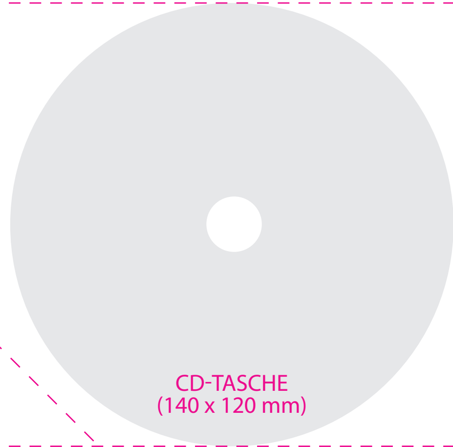
CD-TASCHE (140 x 120 mm)