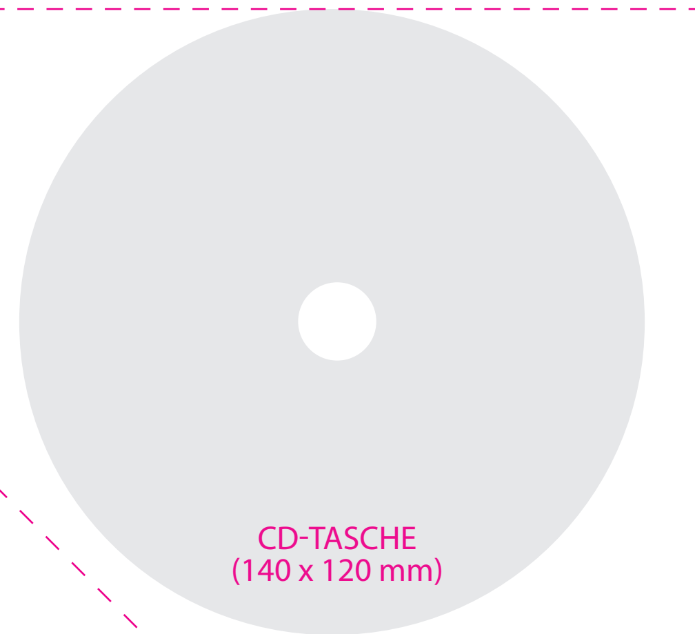
CD-TASCHE (140 x 120 mm)